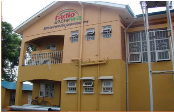
Se organizó una rifa para la construcción del nuevo edificio de la radio